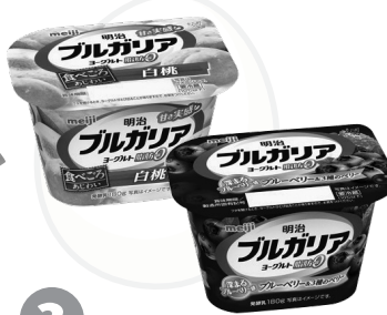
3 明治のヨーグルト180g おすすめ2個セット