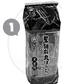
1 黒胡麻丸ぼうろ 黒葉隠黒糖仕込み