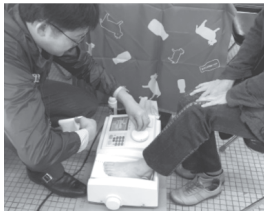
▲健康チェックの様子