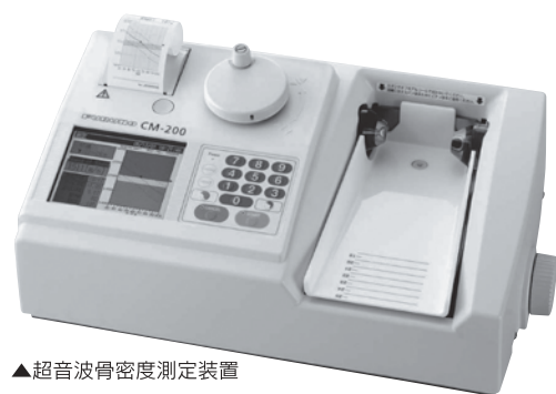
▲超音波骨密度測定装置